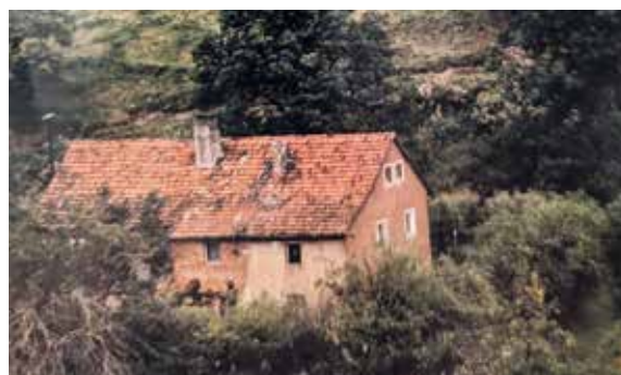
▲ Foto: Früheres Wohnhaus von hinten

Am ersten Fluchttag sind wir in 19 Stunden nur 10 km vorangekommen. Die Straßen waren völlig überlastet, alles voller Flüchtlinge und Militär. Die meiste Zeit standen wir bei Schnee und Kälte und warteten darauf, dass es endlich weiter ging. Für die Tiere hatten wir genug Futter mitgenommen, nur wir hatten kaum etwas zu essen. Nach einem langen Marsch in Eiseskälte waren Mensch und Tier völlig fertig. Der Weg über das Riesengebirge war sehr schwer. Die Pferde rutschten oft wegen ihrer Eisen aus. Die Ochsen hingegen bewältigten die glatten Strecken besser. Leider liefen sie sich dadurch schnell ihre Hufe durch. Wir haben sie mit Säcken umwickelt, um sie besser zu schützen. Aber das hat meist nur kurz gehalten. Oft übernachteten wir auf Bauernhöfen. Die Tiere wurden immer zuerst versorgt. Nichtsdestotrotz bekamen unsere Ochsen irgendwann die Maul- und Klauenseuche. Sie hatten Blasen im Maul und an den Klauen und konnten deswegen nichts mehr fressen. Das eine Mal fiel unser rot-bunter Ochse einfach um und lag da wie tot. Plötzlich kam aus dem Nichts ein Schlachter mit seinem Messer vorbei und wollte das Tier notschlachten. Unsere Mutter warnte ihn und sagte, er solle den Ochsen nicht anfassen. Nach einer halben Stunde hatte er ausgeschlafen, stand wieder auf und es ging weiter. Also machten wir erst einmal einen Tag Pause, damit wir uns alle etwas ausruhen konnten.